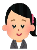
主任介護支援専門員